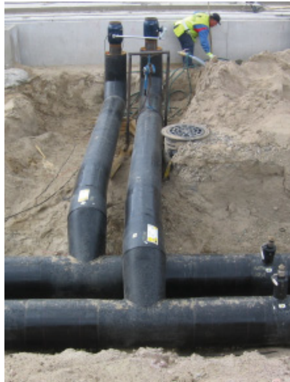
Elomatic tarjoaa kattavia suunnittelu- ja asiantuntijapalveluja kaukolämpötoimijoille.

Pätevät asiantuntijamme laativat Motivan mallien mukaiset energiakatselmukset teollisuudelle, kunnille ja kiinteistöille. Katselmointi tuottaa valmiita ehdotuksia taloudellisesti kannattavista toimenpiteistä. Palveluihimme kuuluvat myös monipuoliset mittaukset ja prosessianalyysit.